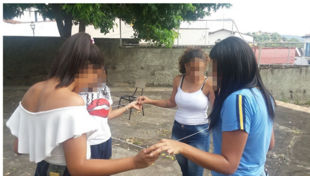
Figura 1: Primeira aula em uma das escolas parceiras do projeto.

A linguagem LOGO [12], criada na década de 1960 no MIT - Massachusetts Institute of Technology , consiste basicamente em fornecer sequências de comandos a uma tartaruga, para que seja possível fazer desenhos na tela. Ela facilita a comunicação entre usuário e máquina, tornando a aluna capaz de solucionar problemas altivamente. Como formação complementar foram ofertadas atividades de computação desplugada baseadas na coleção de materiais didáticos gratuitos que ensinam Ciência da Computação disponibilizados pela organização CS Unplugged 8 . A Figura 1 mostra o registro de uma dinâmica lógica, envolvendo computação desplugada, realizada na primeira aula de cada turma.