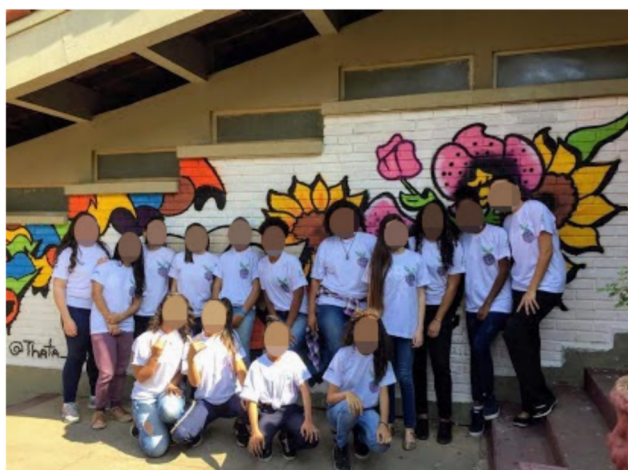
Figura 3: Registro de uma das turmas após receber as camisas do projeto.

Programa Sabará. Posteriormente serão postadas atividades de pensamento computacional e robótica, a fim de que estas possam ser replicadas por outras instituições.