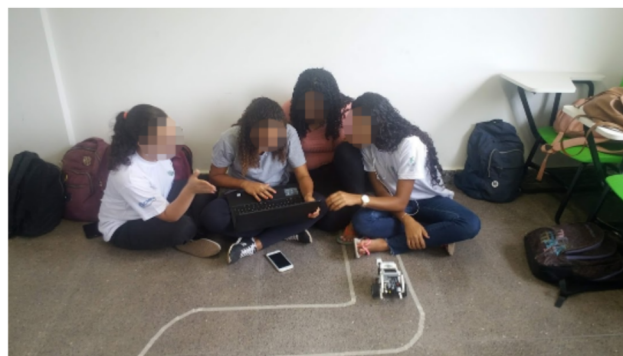
Figura 4: Prática de robótica no laboratório do campus Sabará.

A primeira alteração foi realocar duas turmas para serem atendidas no campus, contudo foi necessário unir uma das turmas já atendidas no local com uma recém designada, para que fosse compatível com cronograma preexistente de reserva dos laboratórios do campus. Em segundo lugar, as turmas que não puderam ser alocadas no campus tiveram a base do conteúdo de robótica trocado de LEGO para Arduino. Este, foi escolhido por ser um equipamento de menor custo e mais fácil de se transportar, permitindo que mesmo as alunas atendidas in loco também tivessem um módulo inteiramente prático. A Figura 4 mostra alunas de uma das turmas que tiveram a robótica baseada no LEGO realizando um desafio.