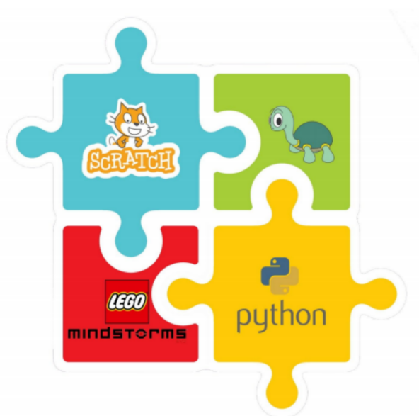
Figura 2: Representação gráfica dos módulos do projeto.