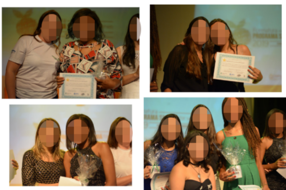
Figura 7: Alunas destaque de cada turma.

deu-lhes mais confiança e proporcionou o aprimoramento da oratória das instrutoras, as quais aprenderam a discursar melhor e, consequentemente, fazer apresentações melhores, tanto no projeto como em seus respectivos cursos. Ademais, uma das instrutoras declarou informalmente: “ da forma como a sociedade está estruturada hoje, estar inserida em um ambiente predominantemente masculino é desafiador, porque frequentemente temos que reafirmar a nossa capacidade, então poder dar aulas em um local que eu não precisava ficar provando que sou capaz, era uma válvula de escape para toda essa pressão ”.