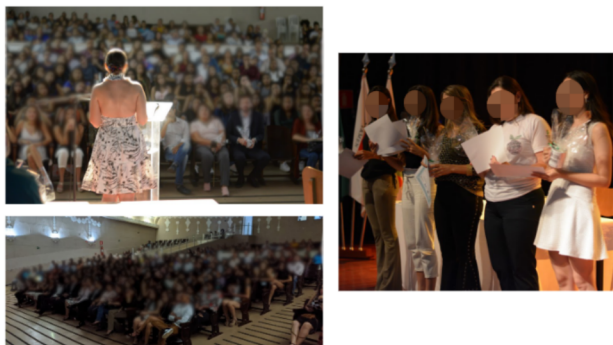
Figura 6: Registros da cerimônia de encerramento do primeiro ano do curso.